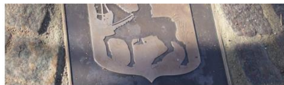
Kultur och fritid