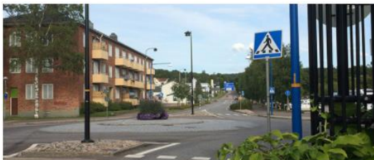
Näringsliv och arbete