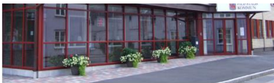
Kommun och politik