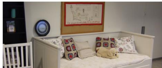
Omsorg och stöd