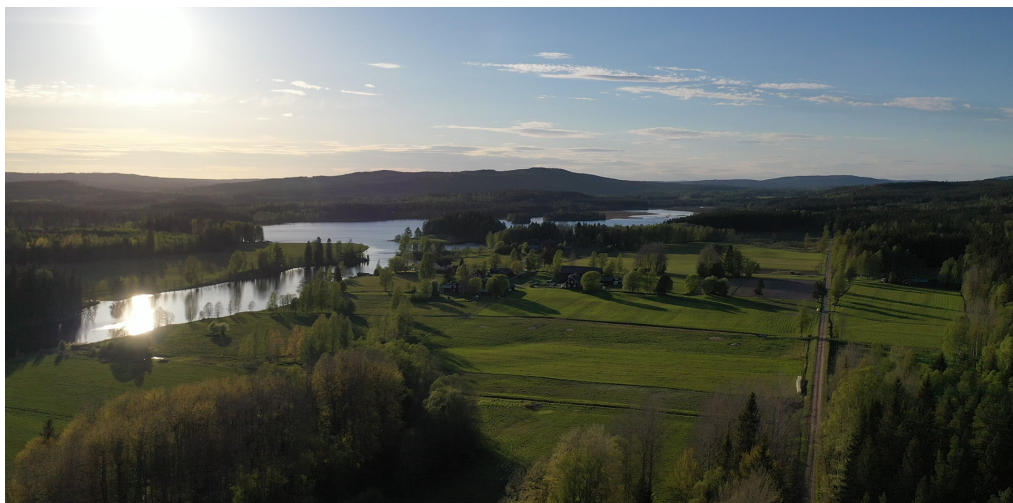
Banvallen med Lersjön och Agen i bakgrunden.

På kartan här intill visas cykelbanans hela sträckning. Dessutom finns det skyltar vid speciella sevärdheter utefter banan.