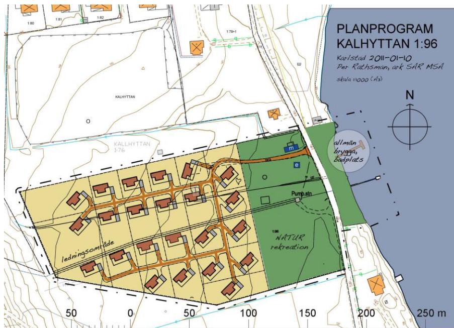
Karta till planprogram för Kalhyttan 1:96, upprättad med anledning av den fritidshusbebyggelse som planeras i området. Filipstads kommun.

Följande antikvariska förundersökning har utförts av Värmlands Museum på uppdrag av Filipstads Sportby med syfte att utreda de kulturhistoriska förutsättningarna inför planerad detaljplaneläggning av fastigheten Kalhyttan 1:96. Planen syfte är att reglera den tänkta fritidshusbebyggelsen i området. Uppdraget har utförts av antikvarie Mattias Libeck.