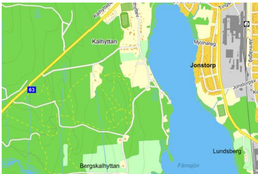
Dagens karta över Kalhyttan som visar hur exploateringen av området stannade av efter 1960-talet bortsett från dagens skidanläggning. Lantmäteriet.