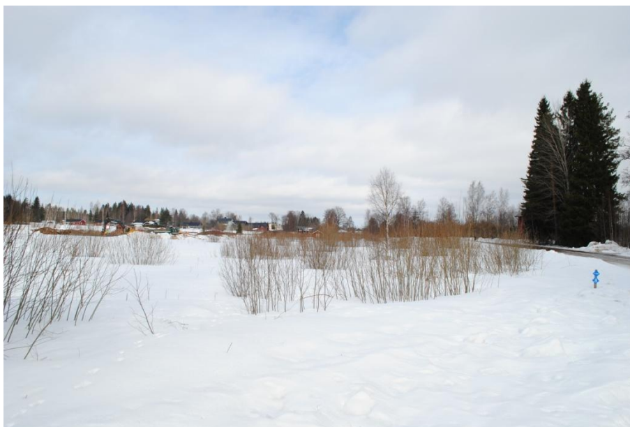
Pågående markberedningsarbeten på fastigheten Kalhyttan 1:96. Vy söderifrån.

Kalhyttan herrgård låg länge som en solitär i landskapet men under 1900-talet tättade bebyggelsen runtom med ny villabebyggelse, huvudsakligen uppförd under första hälften av förra seklet. Utöver Herrgården med tillhörande ekonomibyggnader finns enstaka byggnader som är uppförda runt sekelskiftet 1900 eller tidigare, däribland torpet "Stommen".