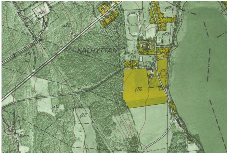
Ekonomiska kartan från 1965 visar att bebyggelsen tätat norr om herrgården med idrottsplats och villabebyggelse utmed sjön. Lantmäteriet.