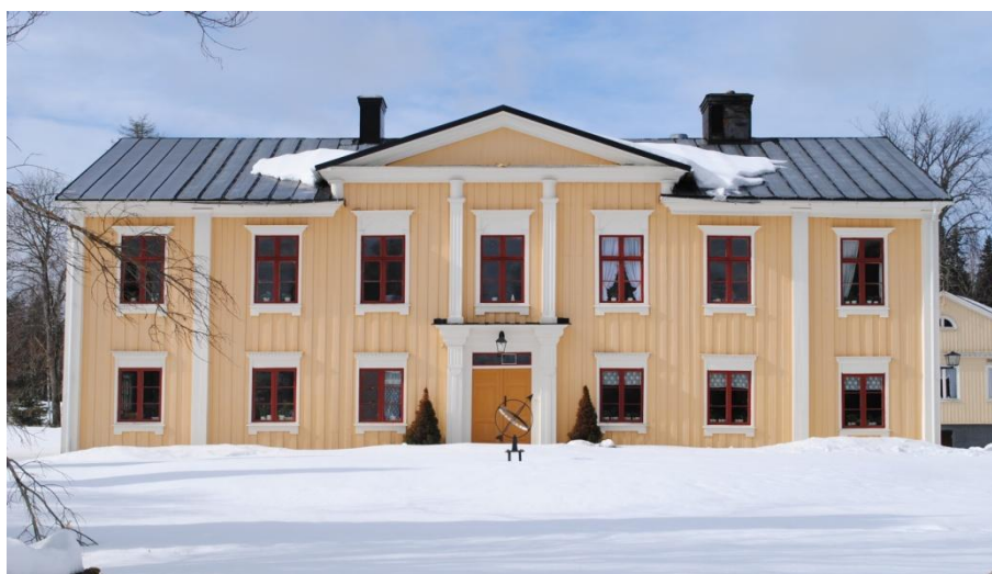
Kalhyttans herrgård i slutet av mars 2011.

Äldre kartor visar att marken som är planerad att bebyggas genomgått tämligen små förändringar under de senaste århundradena. Området mellan bebyggelsen runt Kalhyttans herrgård i norr och byn Bergskalhyttan i söder har i historisk tid huvudsakligen tjänat som jordbruksmark. Under 1900-talets början tätar bebyggelsen runt herrgården med ny villabebyggelse och enstaka fastigheter bebyggs utmed Färnsjön. Under de sista 50 åren har få synbara förändringar skett. Den bebyggelse som tillkommit har huvudsakligen uppförts i anslutning till befintlig bebyggelse runt Kalhyttans herrgård.