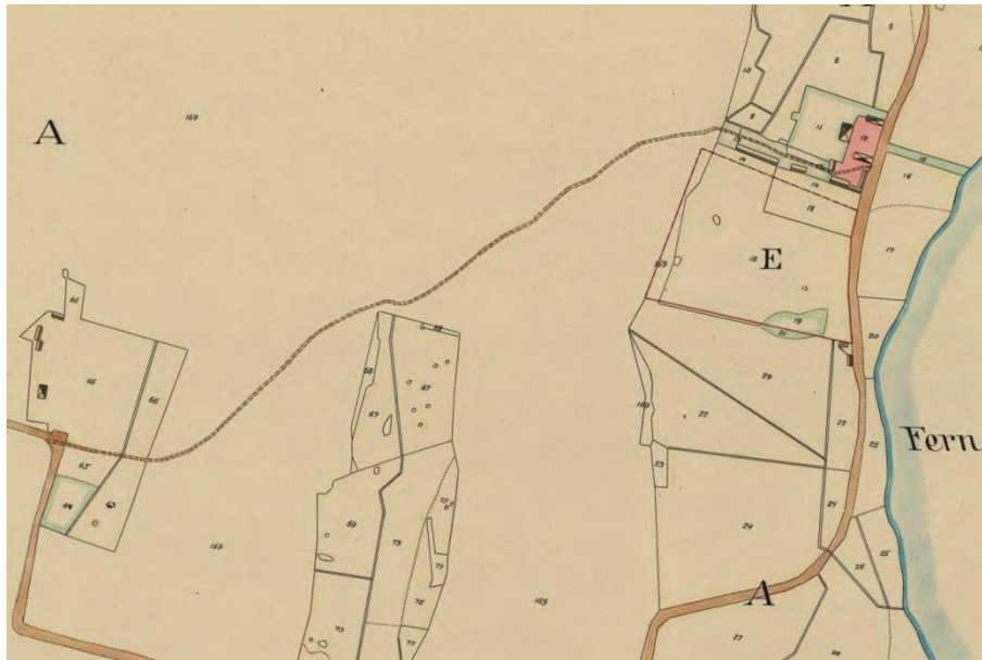
Karta från Laga skifte 1844, som visar det lilla torpet "Stommen" söder om herrgårdsanläggningen. Lantmäteriet.