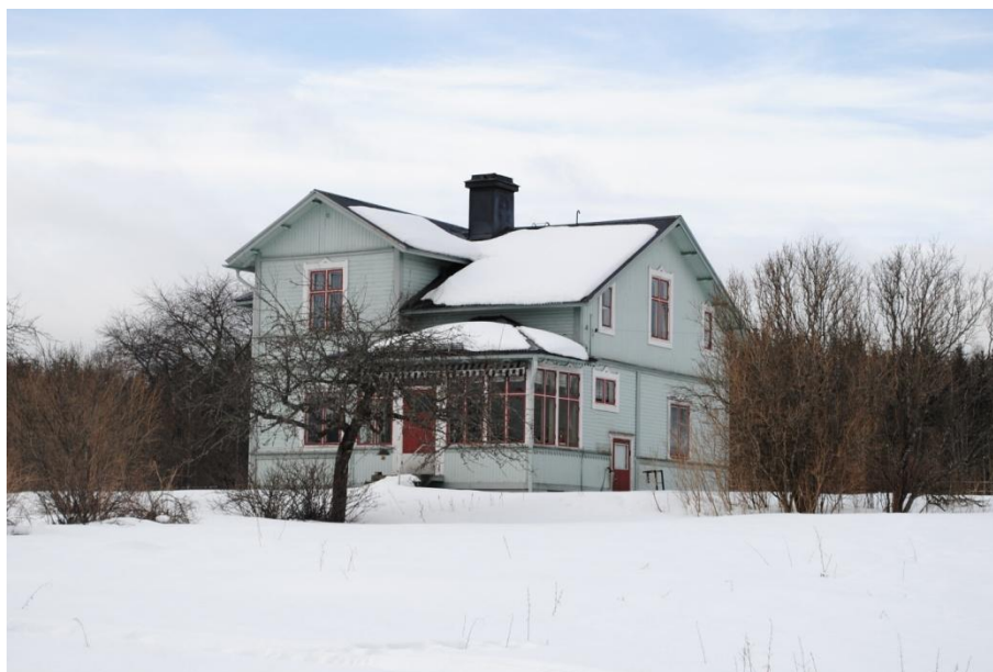
Ett vackert bostadshus från förra sekelskiftet beläget strax norr om den planerade sportbyn.

Bebyggelsen i närområdet är tämligen blandad. Utmed Kalhyttvägen norrifrån ligger villabebyggelse uppförd under första hälften av 1900-talet. Någon enhetlig utformning beträffande fasad- och takmaterial eller färgsättning går inte att tala om. Utmärkande är istället den återhållsamma skalan och de generösa tomterna. Längre söderut tar en äldre bebyggelse vid med den herrgården med sin gulmålade väggpanel och svartmålade takplåt i centrum. Till områdets ålderdomliga karaktär bidrar i hög grad bevarade ekonomibyggnader traditionellt utförda med faluröd brädpanel och vit puts. Här finns även torpet "Stommen" liksom ett mycket stillfullt blåmålat hus uppskattningsvis uppfört vid 1900-talets början. Det senare bedöms vara mycket välbevarat och har sirliga snickeridetaljer, stilenlig glasveranda och en historisk färgsättning med grönblå fasader och röda fönstersnickerier. Till omgivningen hör också ett antal byggnader belägna utmed Färnsjön, sydost om den framtida sportbyn, vilka alla är traditionellt målade i faluröd kulör.