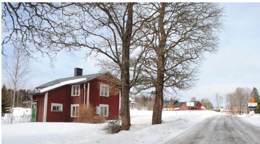
Foto taget i höjd med den planerade sportbyn med vy mot norr. Bostadshuset i förgrunden är torpet "Stommen" med anor från åtminstone 1800-talets början.

Kalhyttan herrgård låg länge som en solitär i landskapet men under 1900-talet tättade bebyggelsen runtom med ny villabebyggelse, huvudsakligen uppförd under första hälften av förra seklet. Utöver Herrgården med tillhörande ekonomibyggnader finns enstaka byggnader som är uppförda runt sekelskiftet 1900 eller tidigare, däribland torpet "Stommen".