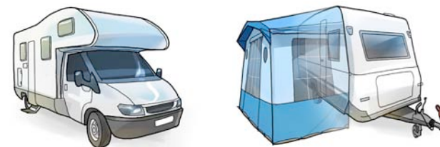
Exempel på campingenheter.

Anslutningsledningar mellan elstolpe och husvagn bör inte vara mer än 25 meter. Undvik sladdvindor, och om sådana används: rulla ut hela sladden. I en upprullad sladd kan värmen stiga så att isoleringen smälter, i värsta fall med strömförande bil och husvagn som följd.